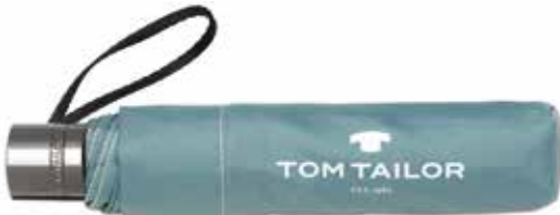
Farbe/color - mineral green