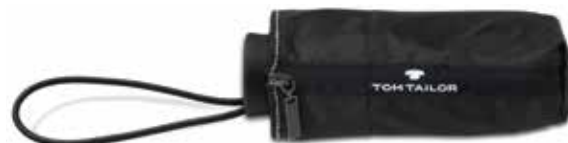
Farbe/color - black