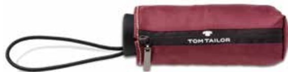
Farbe/color - zinfandel