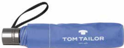
Farbe/color - sicilian blue