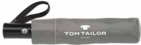
Farbe/color - anthra