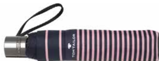
Farbe/color - stripes