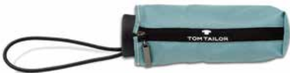
Farbe/color - mineral green