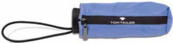
Farbe/color - sicilian blue