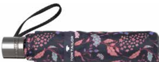
Farbe/color - flower print