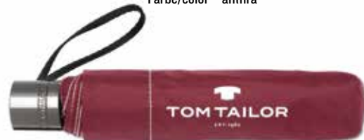
Farbe/color - zinfandel