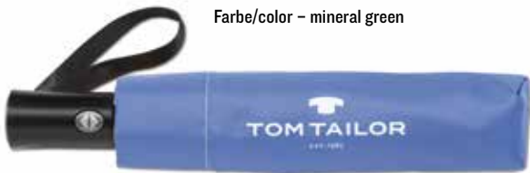
Farbe/color - sicilian blue