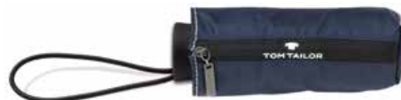
Farbe/color - navy