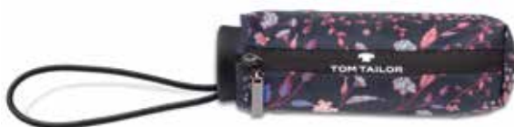
Farbe/color - flower print