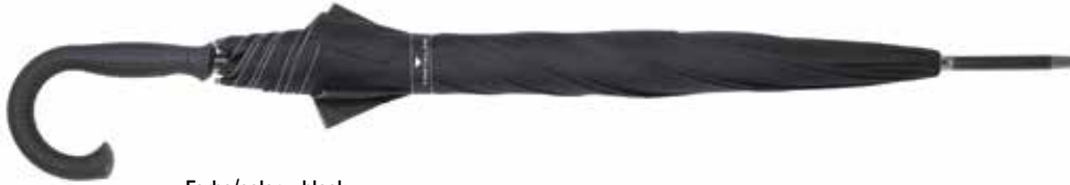
Farbe/color - black