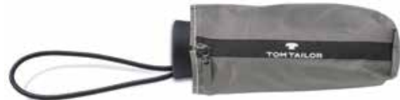
Farbe/color - anthra