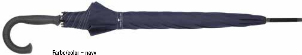
Farbe/color - navy