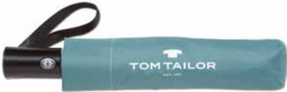
Farbe/color - mineral green