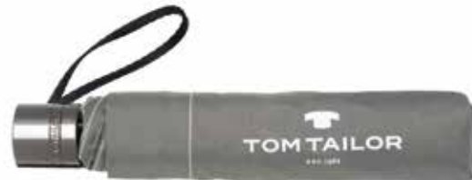
Farbe/color - anthra