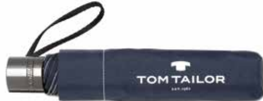
Farbe/color - navy