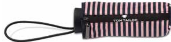
Farbe/color - stripes