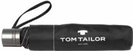
Farbe/color - black